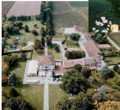
In alto e a sinistra. Villa Ormaneto, tenuta di caccia del 1300 nella bassa veronese, con la cappella dedicata a San Michele Arcangelo. Sopra. Il taglio della torta davanti agli alberi di noci del Caucaso illuminati. Sotto. Cerimonia open air.