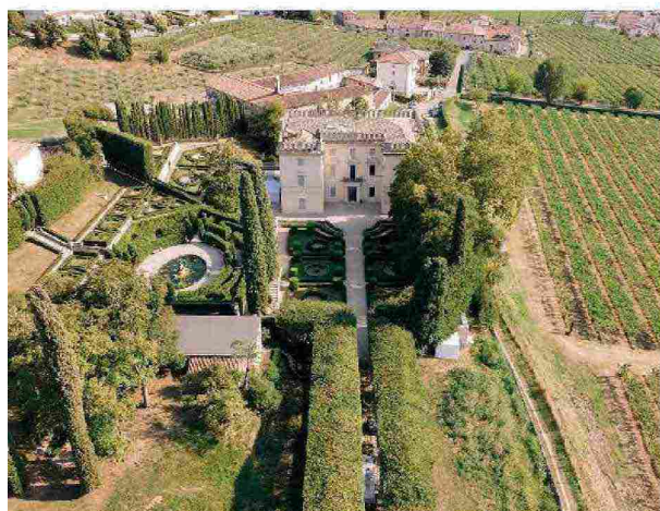
Sopra. Una veduta dall'alto di Villa Rizzardi a Negrar in provincia di Verona. A destra. Tavoli allestiti lungo il viale alberato che conduce alla villa.