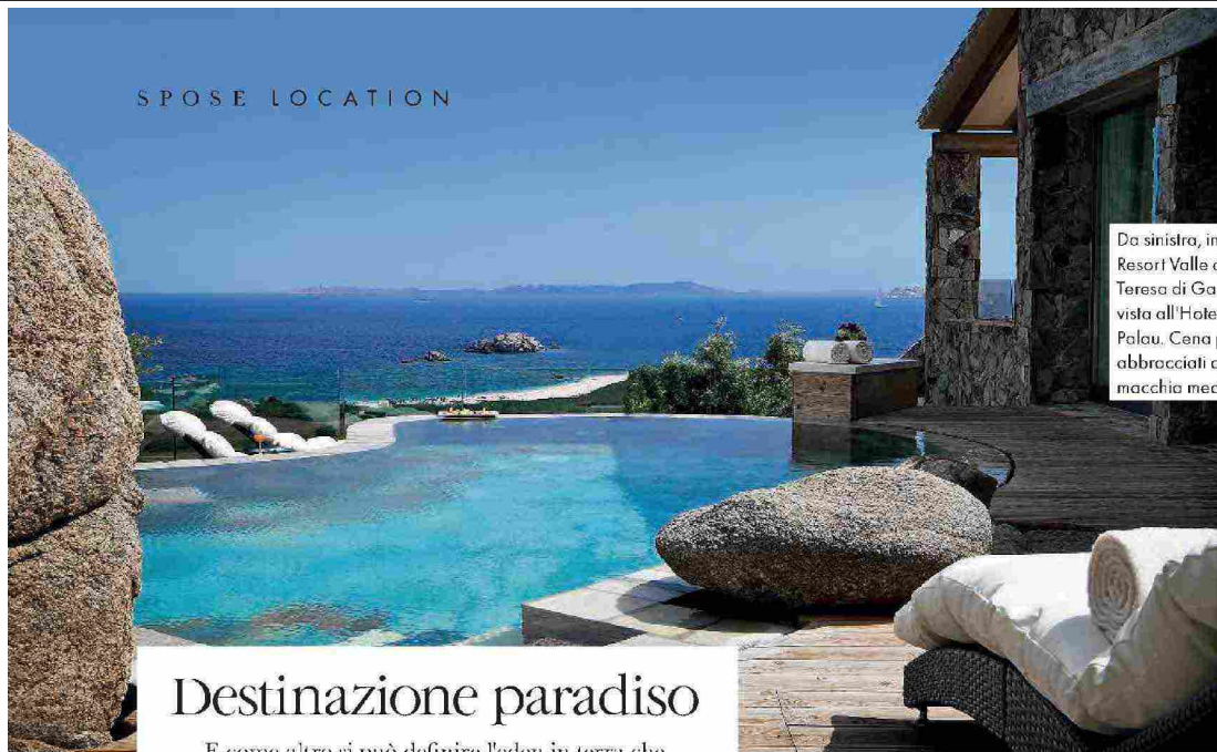
Da sinistra, in senso orario. Resort Valle dell'Erica a Santa Teresa di Gallura. Amaca con vista all'Hotel Capo d'Orso a Palau. Cena pieds dans l'eau, abbracciati del granito e dalla macchia mediterranea.