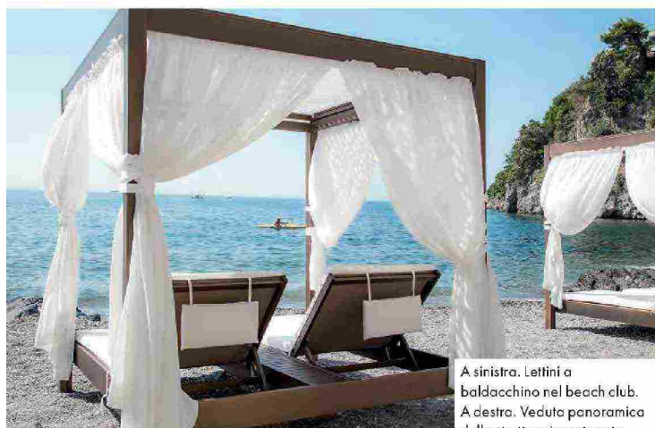
A sinistra. Lettini a baldacchino nel beach club. A destra. Veduta panoramica della struttura incastonata nel suggestivo panorama della Costiera Amalfitana.