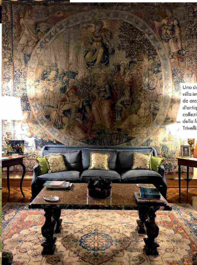
Uno dei saloni della villa impreziosito da arazzi e oggetti d'antiquariato della collezione privata della famiglia Spalletti Trivelli.

Per chi ama il lusso senza compromessi, discreto e intimo, Villa Spalletti Trivelli, luxury boutique hotel nel cuore di Roma, è il posto perfetto. Dimora patrizia dei primi del Novecento, tra sale ad alto impatto scenografico con arazzi e arredi antichi, con uno splendido giardino all'italiana, ospita nozze con servizio placée fino a 50 ospiti o cocktail champagne fino a 150. Non manca l'area relax con centro benessere, hammam e terrazza-solarium ( villaspalletti.it ).