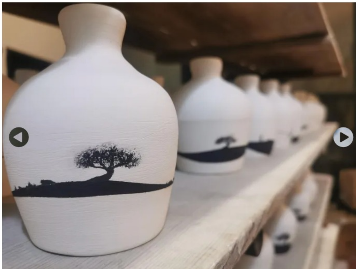
Castelfalfi Olio EVO 2022 limited edition Gianni Lucchesi

Ecco alcune idee per oggetti di valore assoluto ma anche piccole-grandi esclusive da mettere sotto l'albero. Ed il successo è garantito